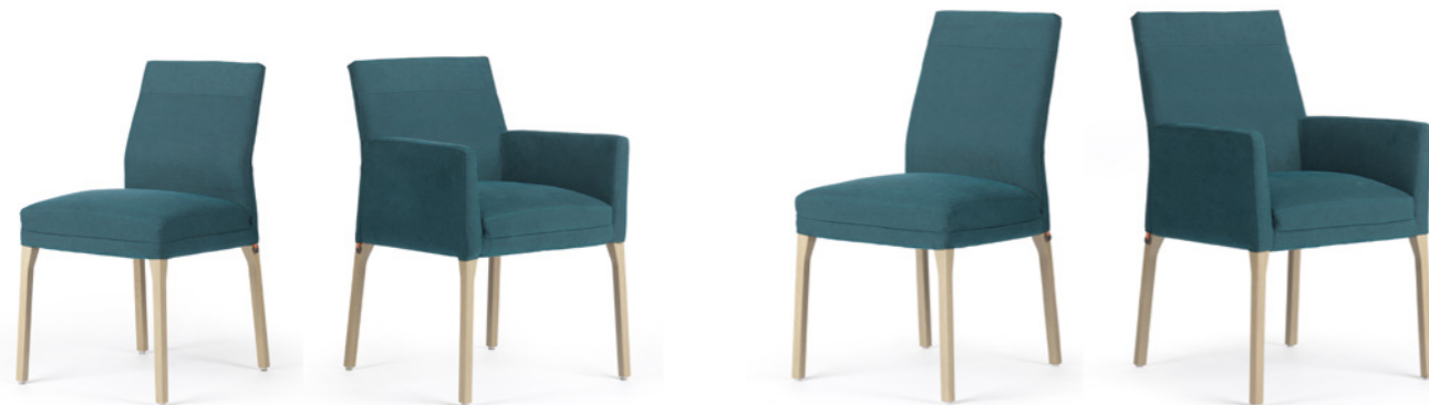
Kali UNI -A