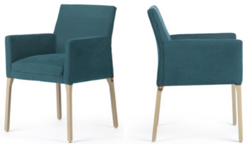
Kali UNI +A